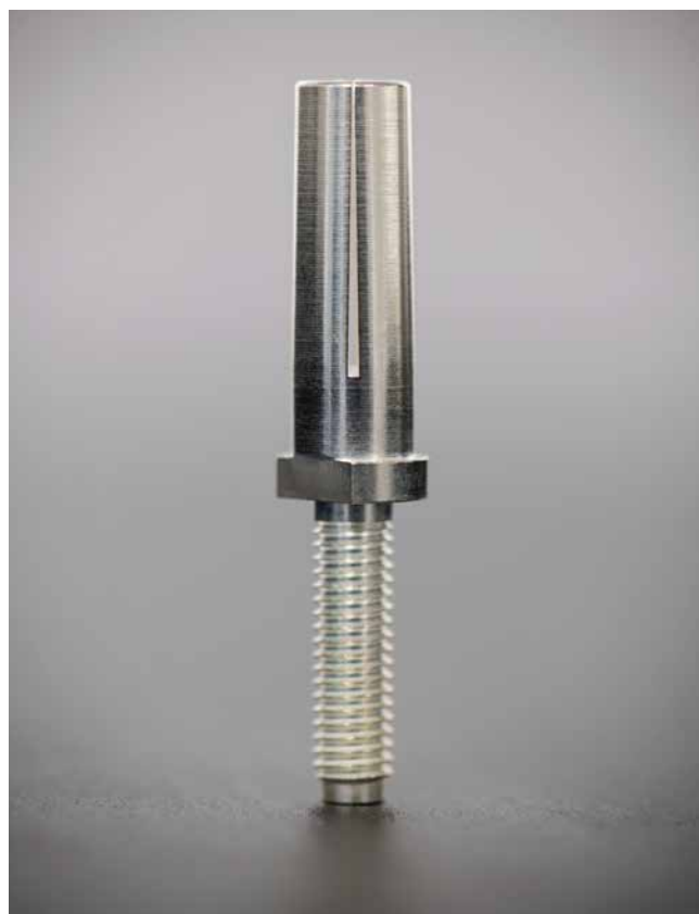
Robustes Kontaktsystem ODU TURNTAC®

Das ist erst der Anfang. Die neuen IT-Lösungen – sie werden gegenwärtig von den Endanwendern am Hauptstandort in Mühlendorf genutzt – werden demnächst in Form eines templategestützten Rollouts in den Produktionswerken in China und in Rumänien eingeführt.