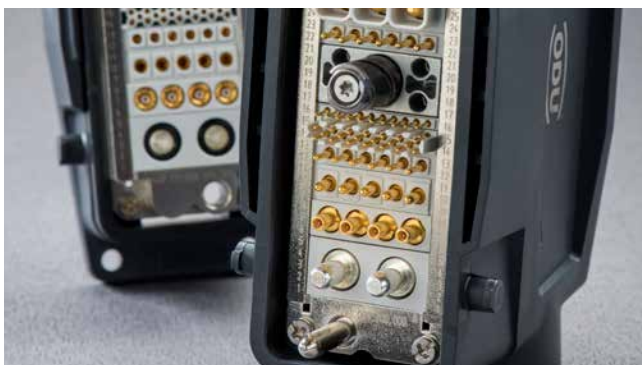
Modularer Steckverbinder – ODU-MAC® Blue-Line