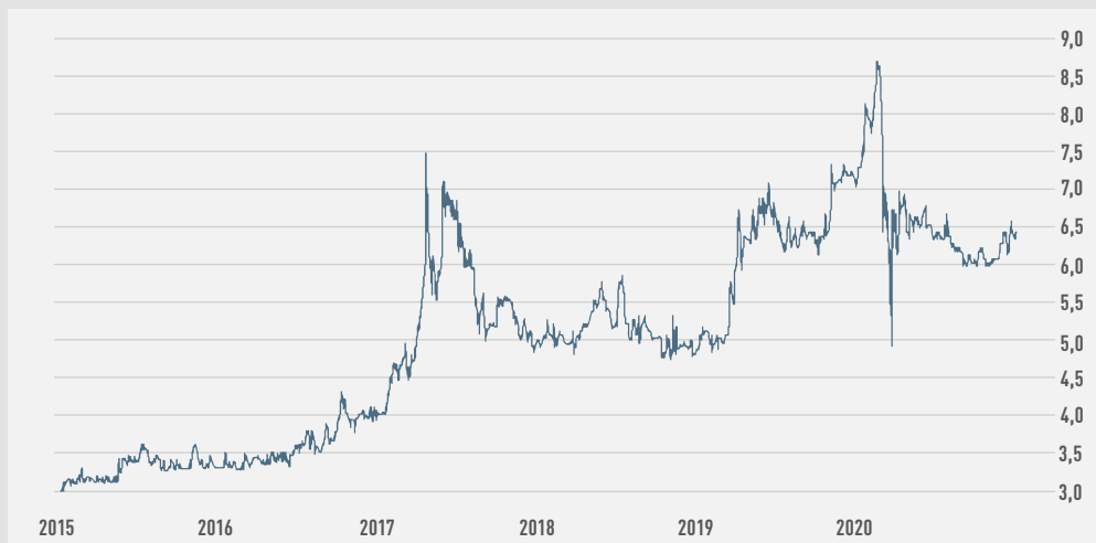
Entwicklung des ORBIS-Aktienkurses 2015 – 2020