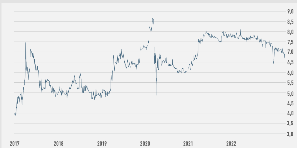
Entwicklung des ORBIS-Aktienkurses 2017 – 2022