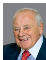
Prof. Dr. h. c. mult. Reinhold Würth, Vorsitzender des Stiftungsaufsichtsrats, Würth-Gruppe